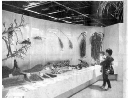
館内並ぶさまざまな展示物